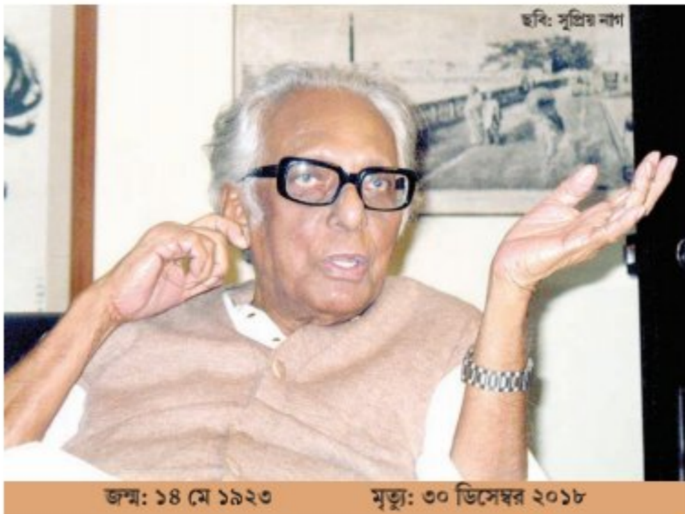
জন্ম: ১৪ মে ১৯২৩ মৃত্যু: ৩০ ডিসেম্বর ২০১৮